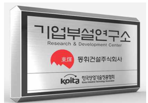
(입구 부착형 현판 예시용)